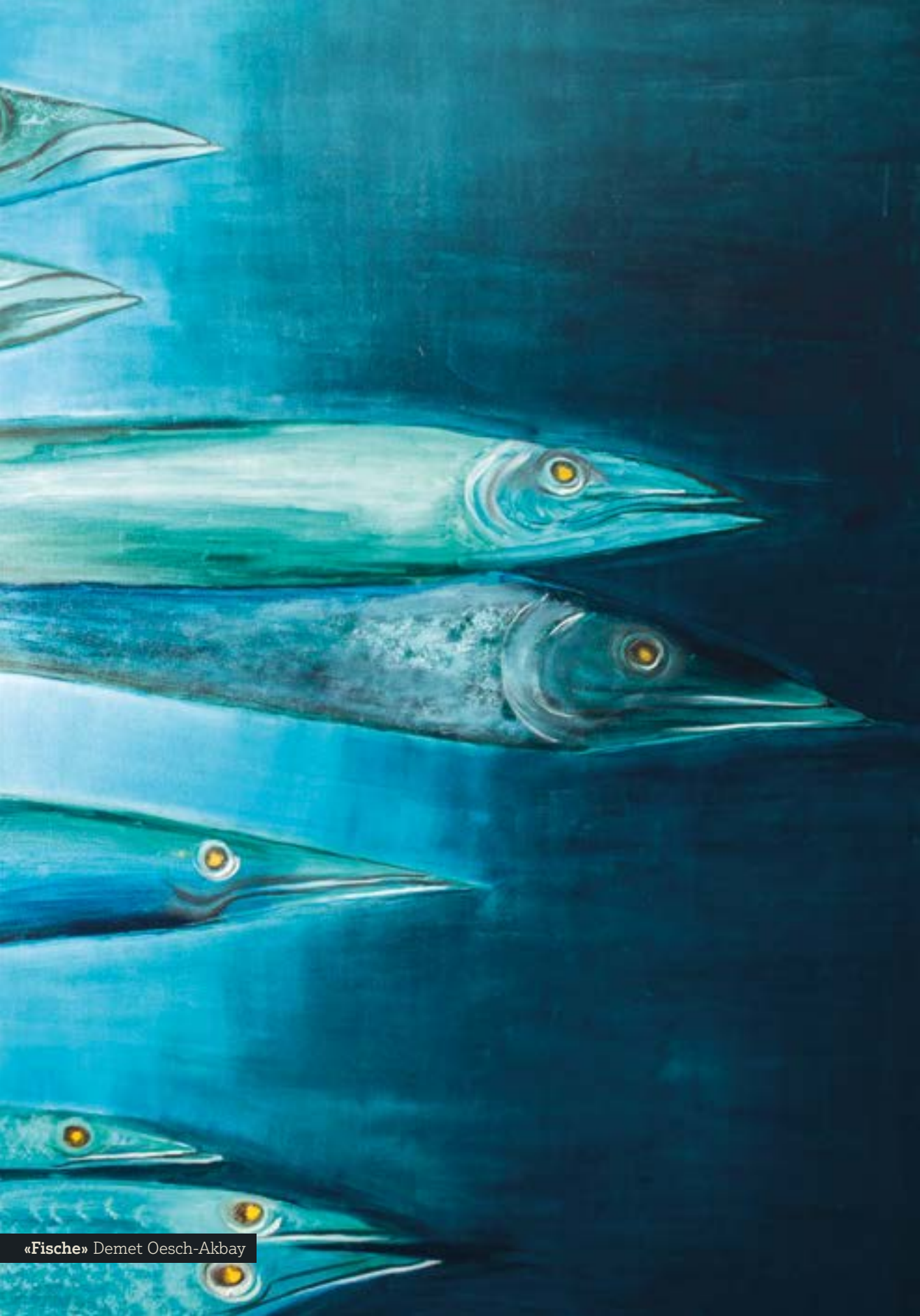
«Fische» Demet Oesch-Akbay