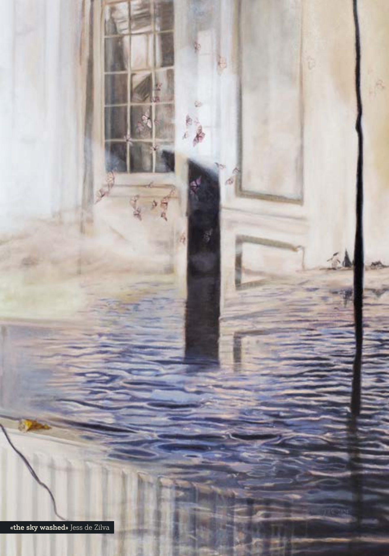
«the sky washed» Jess de Silva