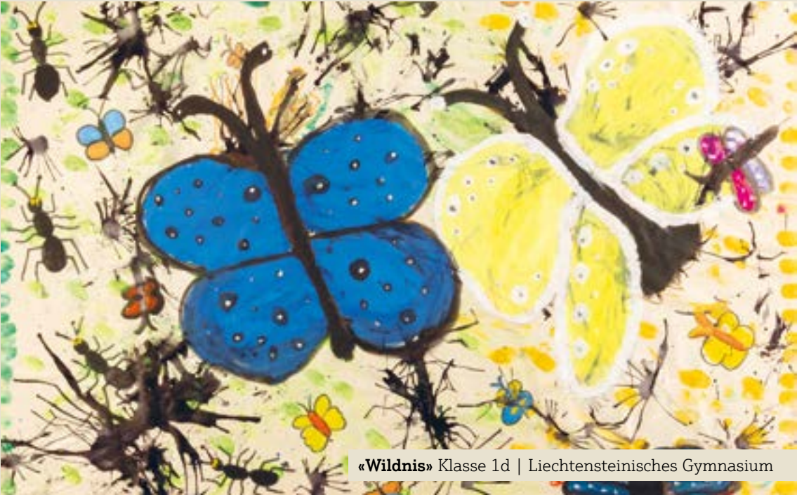
«Wildnis» Klasse 1d | Liechtensteinisches Gymnasium