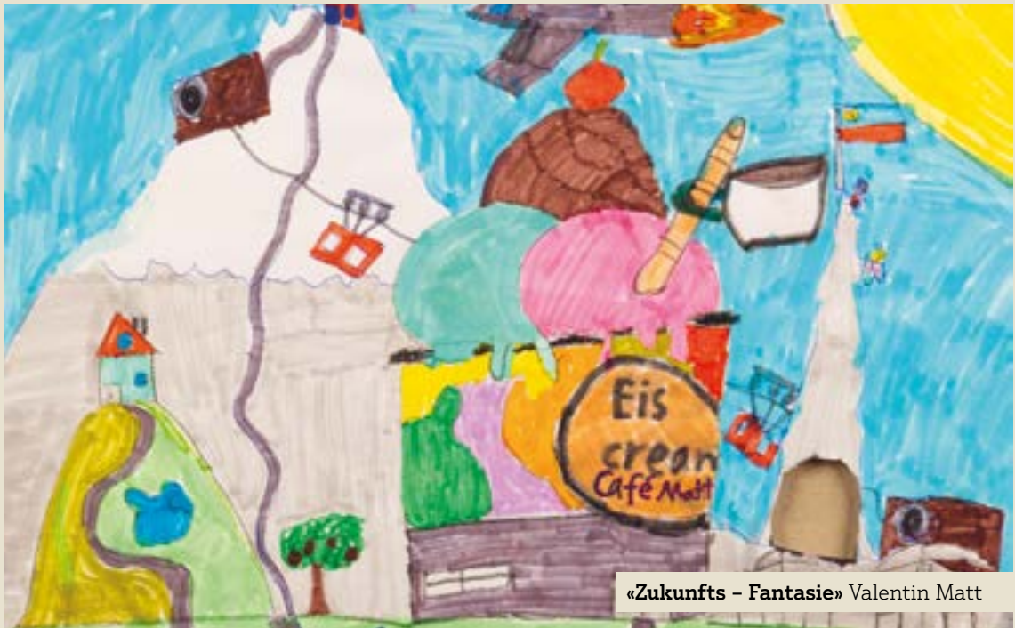
«Zukunftsfantasie» Valentin Matt