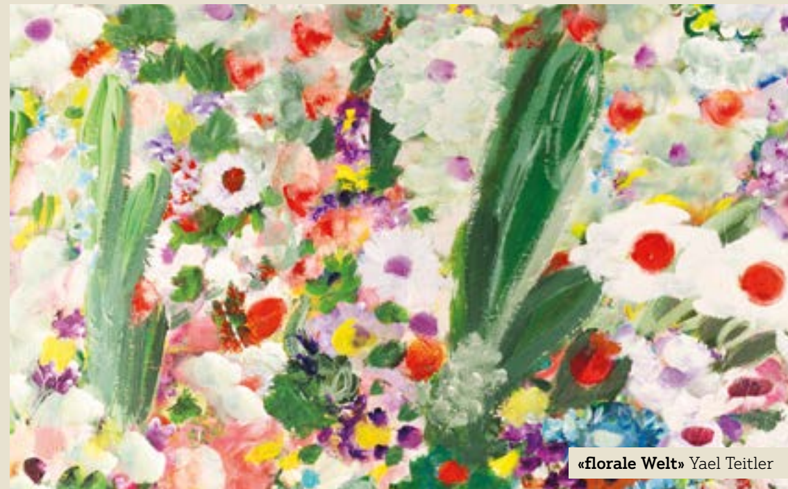
«florale Welt» Yael Teitler

Ort: Unter der Rheinbrücke zwischen Vaduz und Sevelen, auf der Liechtensteiner Seite.