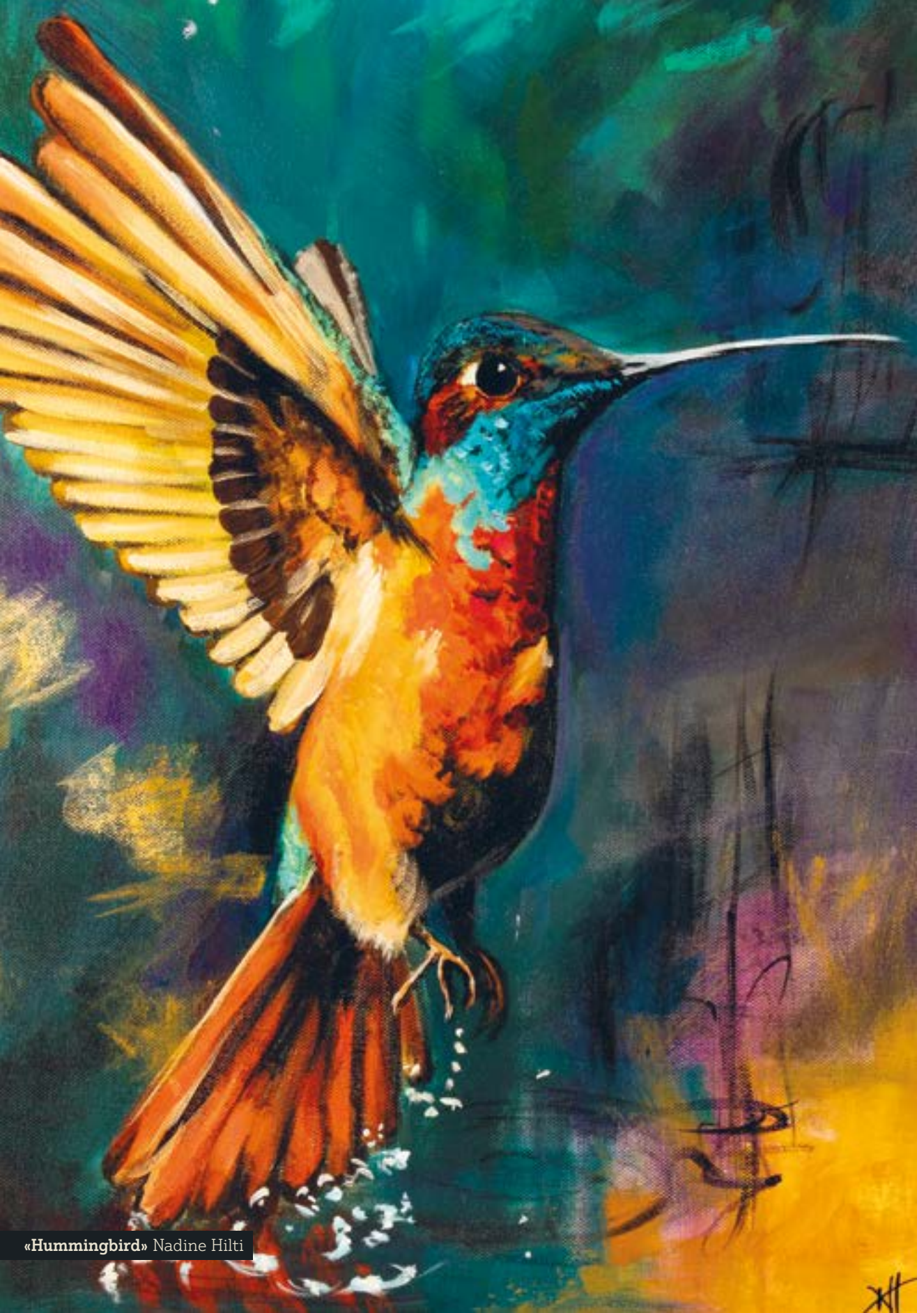
«Hummingbird» Nadine Hilti