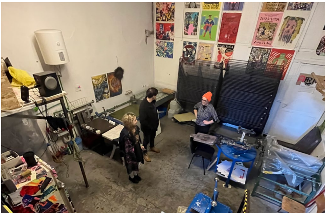
Besuch bei Matriarsija