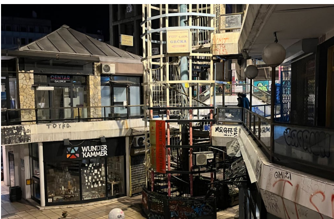
Belgrade Design District, Čumićevo Sokače