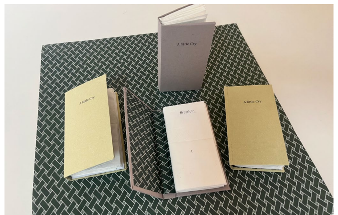
University of Arts in Belgrade, Workshop