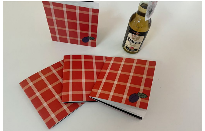
University of Arts in Belgrade, Workshop