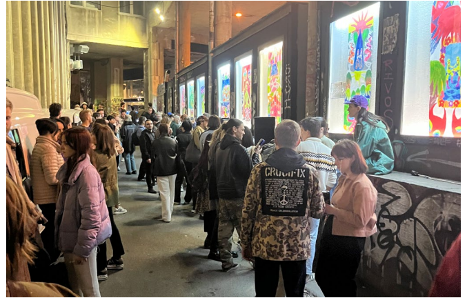
Besuch der Street Gallery