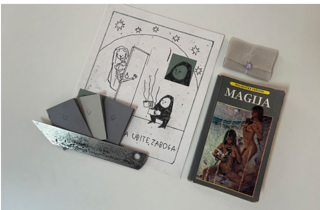
University of Arts in Belgrade, Workshop