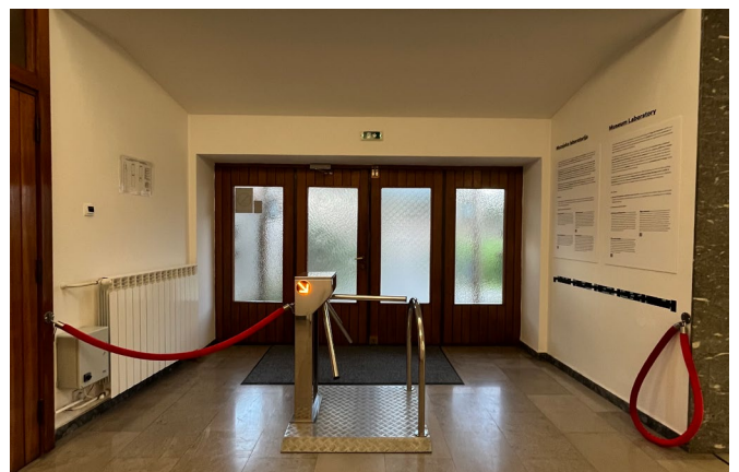
Museum der Geschichte Jugoslawiens