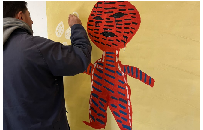
Besuch bei Matriarsija