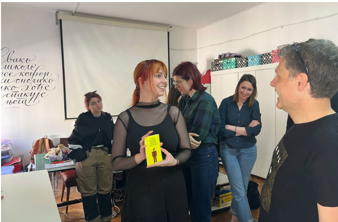
University of Arts in Belgrade, Workshop