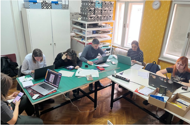
University of Arts in Belgrade, Workshop

Jan Steinbach +41 78 8024036 mail@jansteinbach.net www.jansteinbach.net