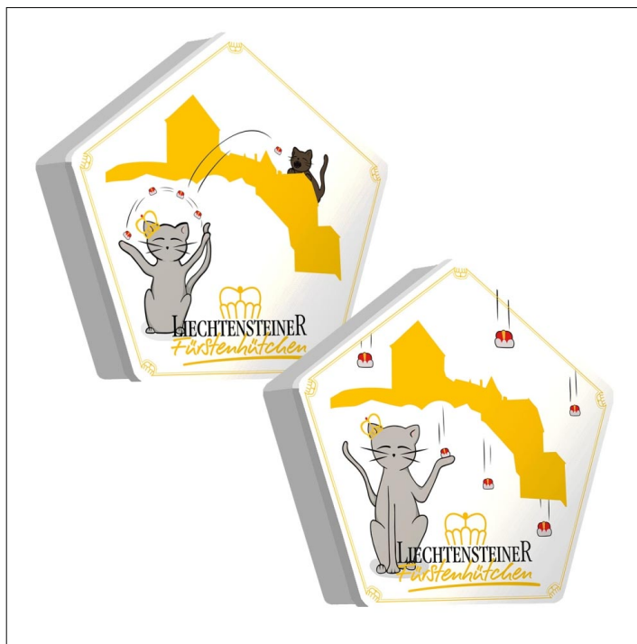
Die Fürstehütchen-Arthur-Edition by Anika Thoma gibt es ab sofort in unterschiedlichen Sujets im Handel und online.

Von der niedlichen Katze Arthur gibt es sogar zwei Sujets. Sie zeigen Arthur jeweils vor Schloss Vaduz in unterschiedli-