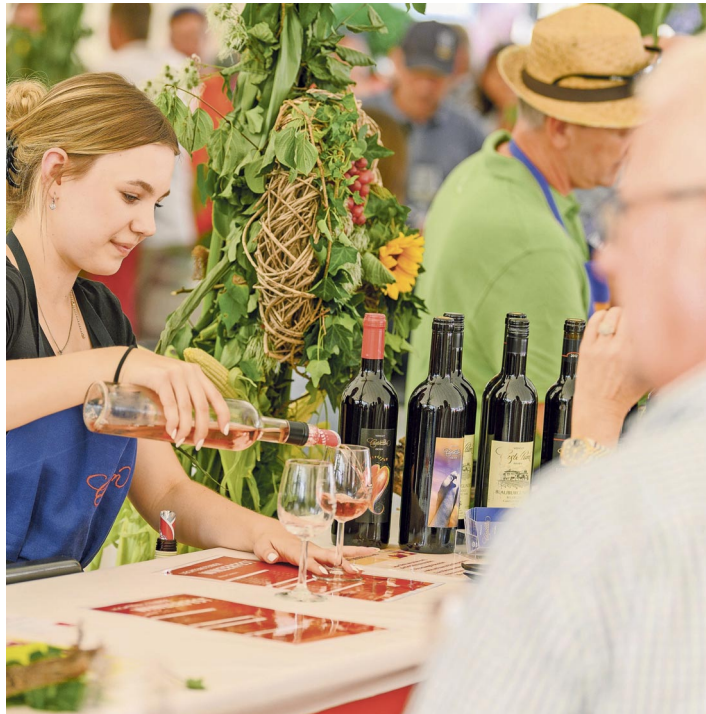
Am 16. September findet im Vaduzer Städtle wieder das beliebte Winzerfest mit edlen Tropfen aus dem Land statt.

Auch in diesem Jahr werden wieder beste Tropfen aus dem ganzen Land auf dem überdachten Rathausplatz in Vaduz ausgeschrieben. Wein aus Vaduzer Trauben schenken die Hofkellerei des Fürsten von Liechtenstein sowie die Winzergenossenschaft Vaduz aus. Aus Triesen begrüßen die Organisatoren den Weinbauverein Triesen sowie Göpf und Silvy Bettchen-Schädler im Städtle. Zusammen mit der Winzergenossenschaft Balzers-Mäls vertreten sie das Oberland am Liechtensteiner Winzerfest.