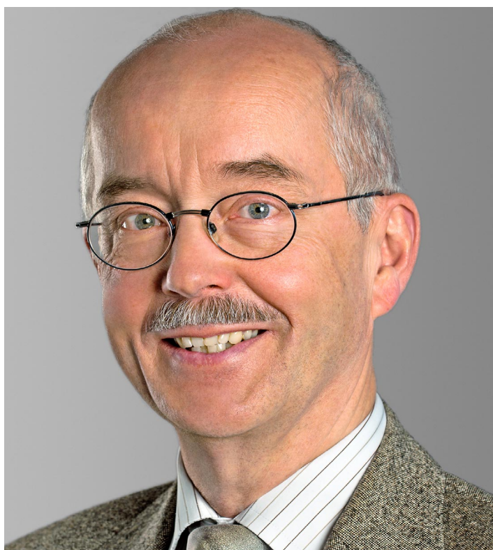
Wie funktioniert der «Doppelte Pukelsheim»? Friedrich Pukelsheim stellt am 20. November 2025 in Gamprin das von ihm entwickelte Verfahren vor.

Do. 20.11. von 18.30 bis 20 Uhr Vereinshaus Gamprin, Haldenstrasse 86, Gamprin-Bendern www.liechtenstein-institut.li