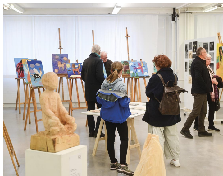
Ausstellung am Tag der offenen Tür.